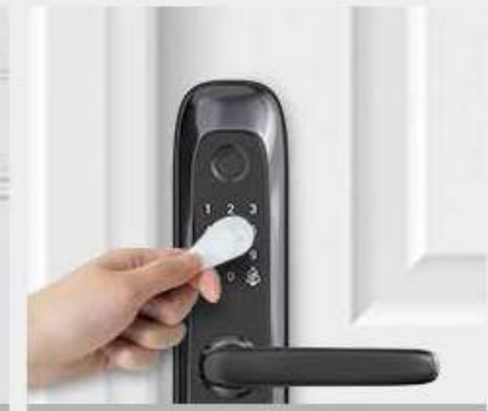
Tarjeta de proximidad